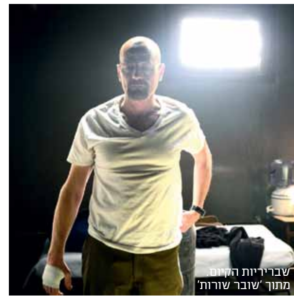
שברירות הקיום מתוך 'שובר שורות'

'הסיבה והתוצאה' גם על המסתורי והלא נודע. הביטחון הרב שלנו באמונות שלנו אינו ערובה לכך שהן מדויקות, ביקש להזכיר פרוף' דניאל כהנמן, אבל הצורך האנושי בוודאות 'דתית' כלשהי הוא בסיסי כל כך, שכל אדם מושתתך בסופו של דבר לדת כלשהי. זו יכולה להיות דת המזון האורגני, פלג האוכל הטבעוני, או זרם ה'אין טלוויזיה ואין ניידים אצלנו בבית'. הכול בקנאות שלא הייתה מביישת את אחרוני הקתולים המאמינים בוותיקן. אנשים מצליחים, למשל, משתייכים לדת חדשה של שליטה עצמית ומיצוי יכולות. ככל ספר מסוג 'מה אנשים מצליחים עושים בבוקר', מתברר שהם קמים עוד שעה מוקדם יותר מאשר בספר הקורס, ומספיקים המון בזמן שכולנו (הכופרים) ישנים. מצליחנים אחרים מתמסרים לדת 'איש הברזל' ולובשים בהתאם מכנסי טייץ, קסדה מדויקת וכפפות בצבע תואם. כולנו מאמינים במשהו, וכן, גם אתם שייכים לדת אחת לפחות.