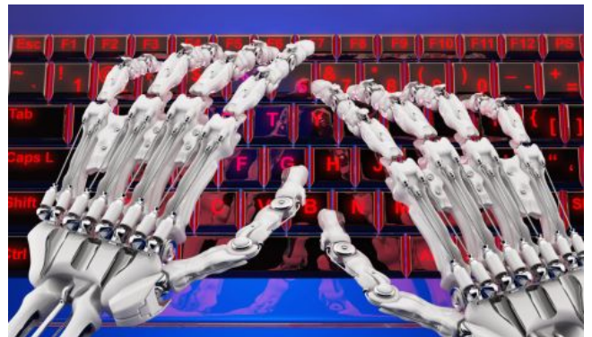
הממשלה צריכה להיערך למחשוב התעסוקה יאיר צדוק | 4