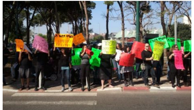
המדינה מגבילה את בעלי המוגבלות מיכל פיינברג דורון